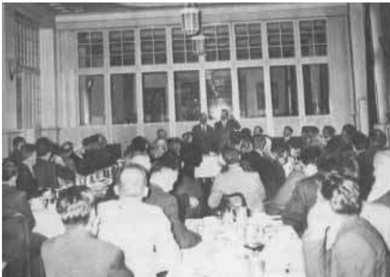
4. fotografija Lausanne, Švajcarska

Dr. Guggenbuhl je rekao: "Fotograf je koristio nemački fotoaparat koji je među najboljima na svetu. Uslikao je desetak slika u sali za svečanosti pre ovih, i uslikao je desetine slika nakon ovih, a sve su ispale normalno, tako da ne može biti da nešto nije u redu s fotoaparatom."