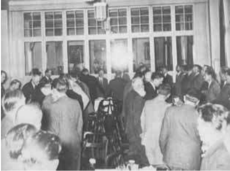
3. fotografija Lausanne, Švajcarska

Na četvrtoj slici svi propovednici sede osim Billa i njegovog prevodioca. Svetlo se smanjilo na oko 60 cm u prečniku i sada izgleda kao aura iznad Billove glave, ali nepravilna aura koja je teža na njegovom desnom ramenu. Bill ima podignutu levu ruku u visinu očiju očigledno da bi nešto naglasio dok govori.