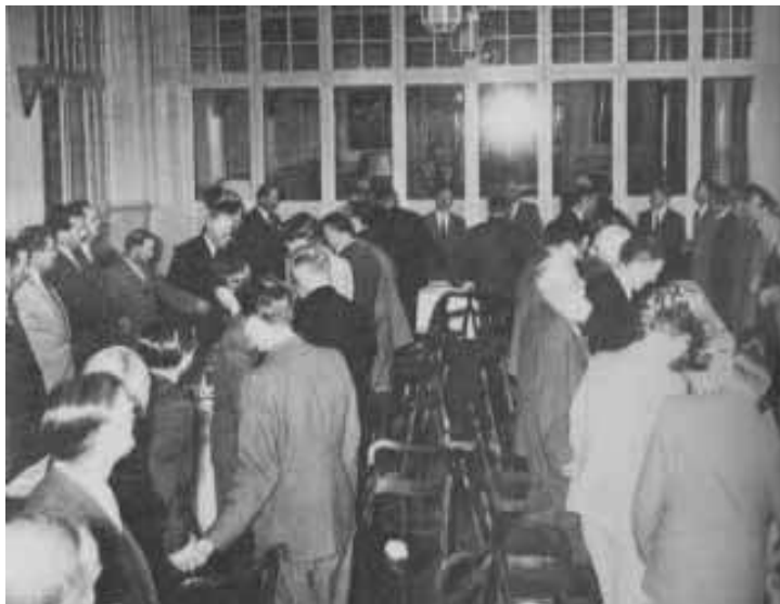
2. fotografija Lausanne, Švajcarska

Treća slika prikazuje kao pamučnu svetlosnu kuglu kako okružuje Billovu glavu i potpuno je zaklanja.