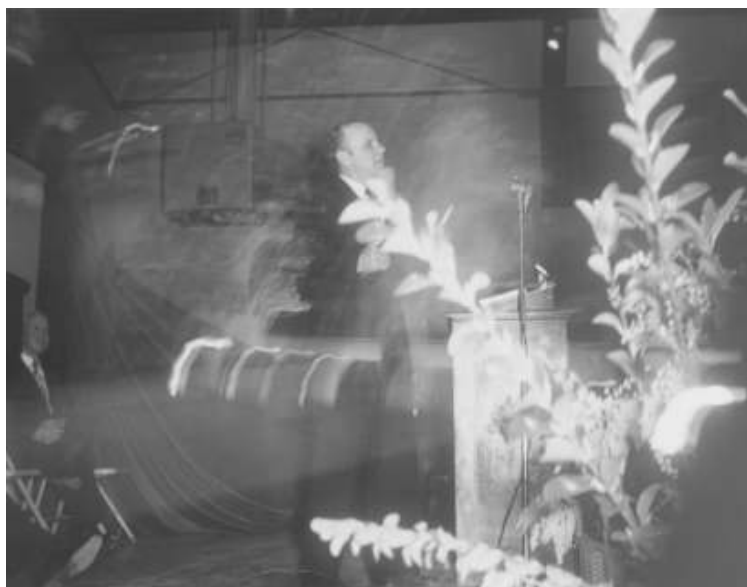
2. slika – Lakeport u Kaliforniji

Na sledećoj fotografiji podijum izgleda kao nadrealno slikarstvo, plamti u vatrenim jezičcima i umrljan je slojem jantarne magle. Anđeo Gospodnji stoji Billu s desne strane i izgleda kao oblaka visine oko 180 cm. Stoji između evanđeliste i ljudi koji su se poređali u red za molitvu s leve strane zgrade. (Bill je uvek tražio da ljudi iz reda za molitvu prilaze njemu s desne strane tako da se moraju zaustaviti i stajati u prisutnosti anđela.) Anđeo nije jedina zaprepašujuća vidljiva forma na ovoj slici. Odmah iza Billa je profil Isusa (lice, brada, vrat) s ispruženim rukama i vatrenim jezičcima koji mu lete s ruku – sedam odvojenih plamenova poput glasnika marširaju prema čoveku koji propoveda. Billovo telo kao da je uvučeno u sjaj natprirodne vatre. (Kada je Bill kasnije pogledao ovu fotografiju, rekao je da ga podseća na scene koje su proroci opisali u Jezekielu 1 i Otkrivenju 4:5.)