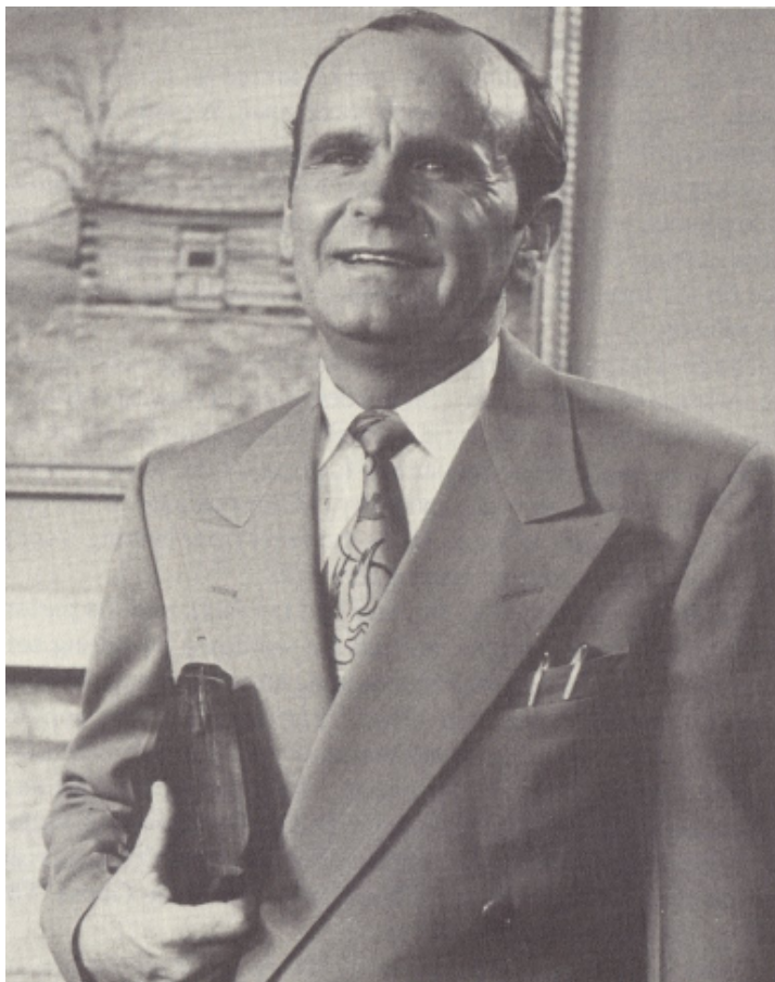
William Branham u vreme snimanja Prorok dvadesetog veka