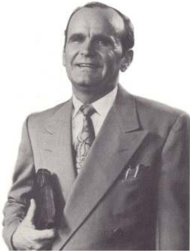
William Marrion Branham